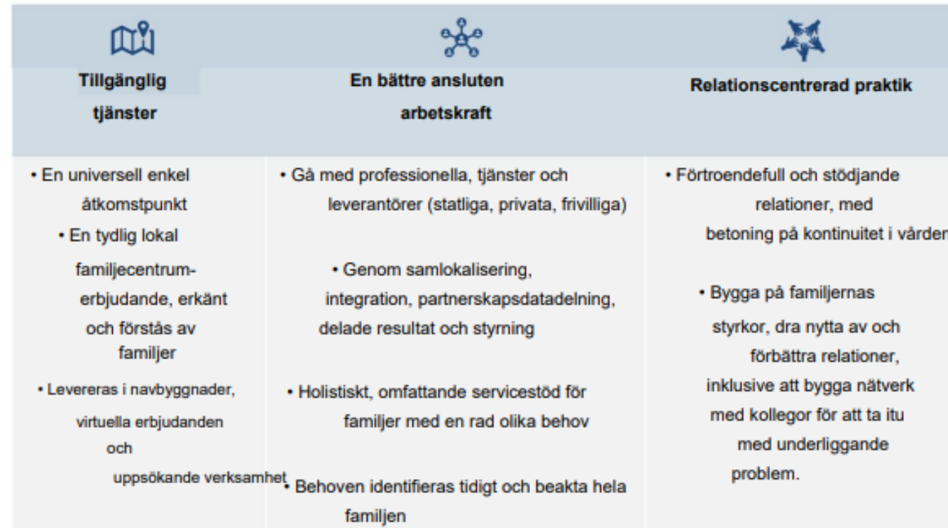
Figur 7. DfE:s kärnavsikter för familjehubbar

Om oss - Nationellt centrum för familjehubbar (nationalcentreforfamilyhubs.org.uk)